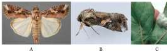
Gambar 1. Fase-fase dalam kehidupan Spodoptera frugiperda .

larva dewasa (1.3 – 1.7 cm) berwarna coklat berkilat. Pupa biasanya di dalam tanah tetapi bias juga terdapat pada tongkol atau pelepah daun jagung. Pupa juga dapat ditemukan pada sisa sisa daun atau material lainnya dalam kokon pada permukaan tanah. Lamanya fase pupa 8 -9 hari, dengan temperature optimum 14.6oC (Rwomushana, 2019; Kementan, 2019).