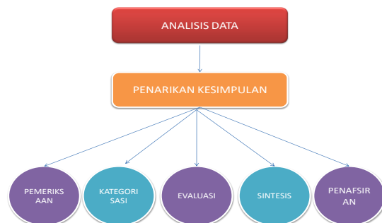
Gambar 1. Teknik Analisis Data (sumber: Lawrence 2014)

Analisis data dilakukan dengan teknik menarik kesimpulan untuk menghasilkan pemaknaan yang bersifat deskriptif. Analisis data dalam kajian kualitatif melibatkan teknik pemilihan, pemeriksaan, evaluasi, kategorisasi, membuat sintesis, membandingkan, dan menafsirkan kode dan data serta menguji data mentah yang telah direkam (Neuman, 2014). Karakterisasi dari hasil akhir riset atau kajian kualitatif adalah menghasilkan koherensi yang bermakna (Tracy, 2013).